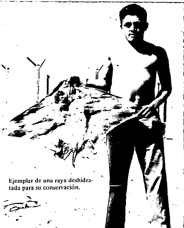
Ejemplar de una raya deshidratada para su conservación.